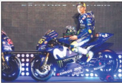
Valentino Rossi sulla nuova moto

Valentino Rossi è prossimo ai 39 anni, al via della 23ª stagione iridata, anche «se è come fosse la prima», il campione di Tavullia è apparso in forma e sorridente. «E' stato un buon inverno, mi sono rilassato, fisicamente sto bene, ho avuto tempo per lavorare».